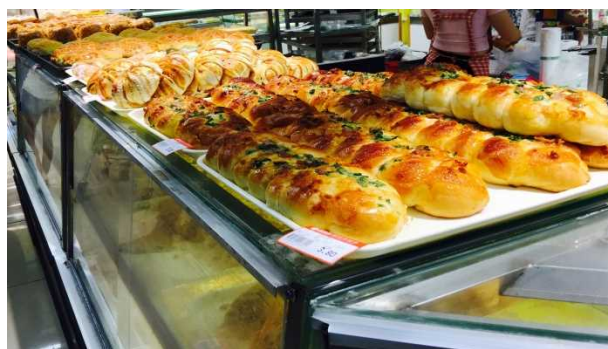
おいしいパンケーキ