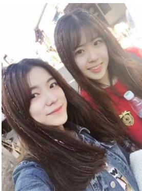
友達が雲南省への旅