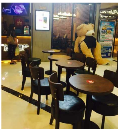
お姉さんとの外出