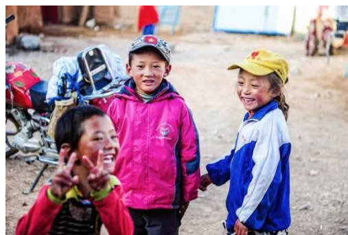
チベットの子ども達