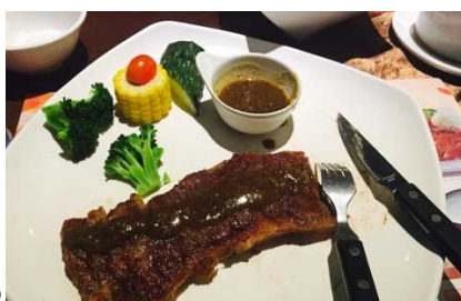
ブラックペーパーソースステーキ