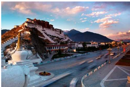
チベットの布达拉宮