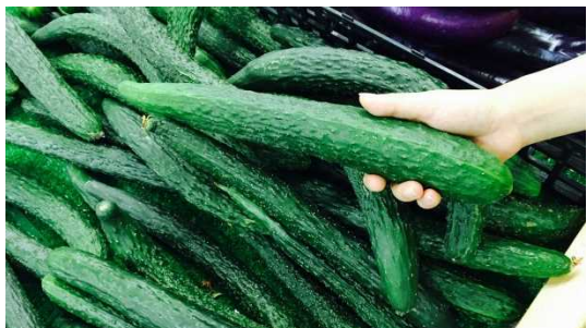
日本にない超デカイ胡瓜