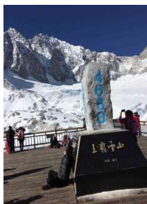
雲南省の玉龍雪山