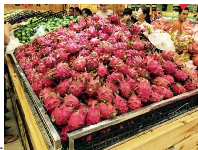
山盛りの ドラゴンフルーツ