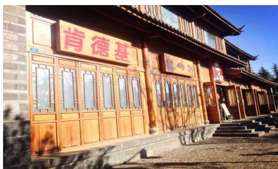
民族風のケンタッキー