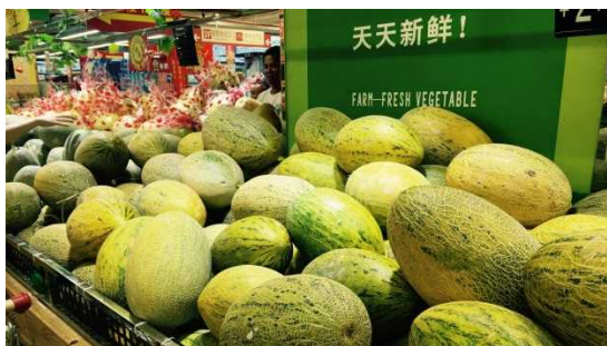
西瓜の大きさと変わらないメロン